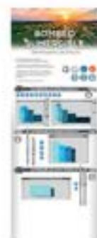
70190023 Bombas Sumergibles