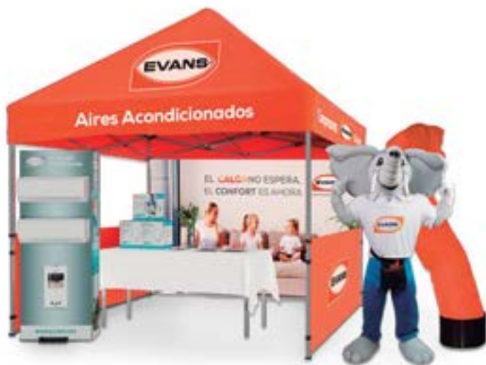
AP-088 Toldo EVANS®