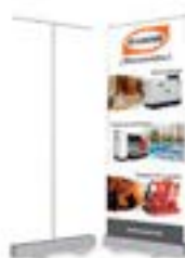
AP-100 Roll-Up 80 x 200 cm