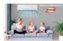
70160816 Acordeón Aires