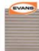
70190022 Respaldo Refacciones 80 x 120 cm