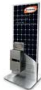
KIT-RACK-PT Exhibidor de Potencia Térmica 100 x 100 x 85cm (No incluye panel)