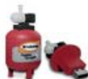
AP-119 USB Hidroneumático