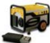
AP-118 USB Generador