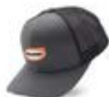
AP-122 Gorra Malla