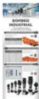
70190004 Bombeo Industrial