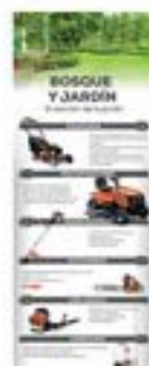
70190008 Bosque y Jardín