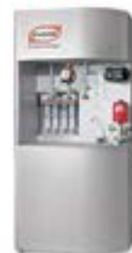
70190052 Módulo Agua 92 x 70 x 210 cm