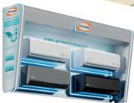
EXH-PARED-AC Exhibidor Pared Aires Acondicionados 240 x 40 x 120 cm