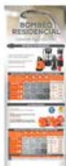
70190003 Bombeo Doméstico