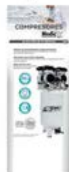
70190049 Compresores Médicos