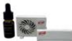
AP-MS-ARO Aromatizante en forma de Aires Acondicionados