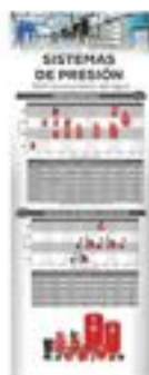
70190024 Sistemas de Presión