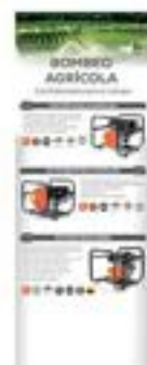
70190010 Bombeo Agrícola