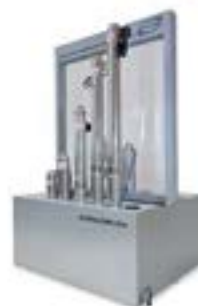
AP-EMLL Módulo Bombas Sumergibles 92 x 150 x 180 cm