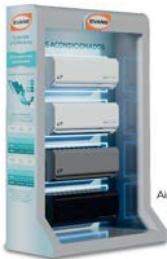
EXH-BASE-AC Exhibidor Base Aires Acondicionados 140 x 60 x 210 cm