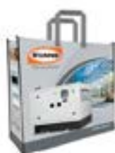
AP-003 Bolsa de Tela Laminada 50 x 50 x 20 cm