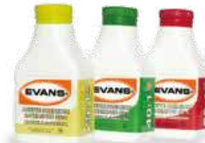
25:1 40:1 50:1